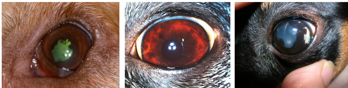
Yeux de chiens atteints d'uvéite : noter les changements de couleur (iris plus foncé) et même les pigments marron (photo de gauche)

L'enveloppe extérieure de l'œil est composée de la cornée transparente et de la sclère blanche. L'enveloppe interne, appelée l'uvée, est une enveloppe à fonction nutritionnelle, très riche en vaisseaux sanguins. Lorsqu'une inflammation se produit au niveau de l'uvée, elle est appelée uvéite. Parce que ce tissu est très vascularisé, l'uvée est une cible naturelle pour de nombreuses maladies originaires d'une autre partie du corps de l'animal (infection, maladie immunitaire, cancer). L'uvéite peut aussi être causée par des maladies intra-oculaires (comme la cataracte), des maladies de la surface oculaire (comme un ulcère de cornée) ou des traumatismes.